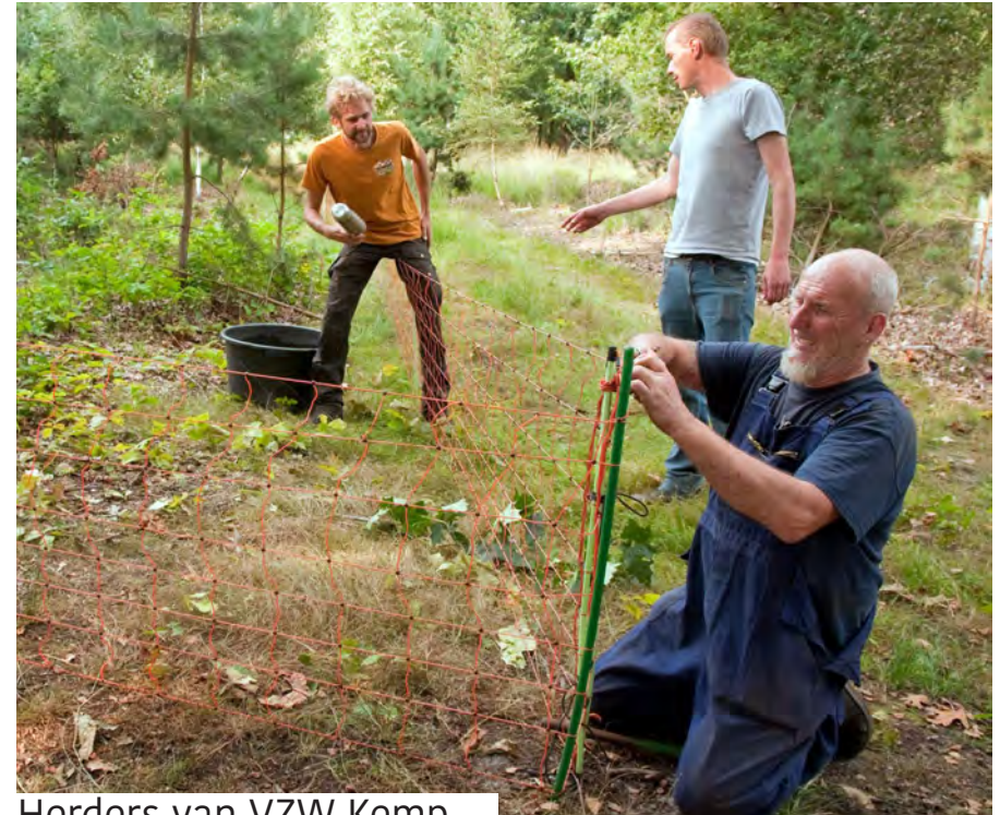
Herders van VZW Kemp