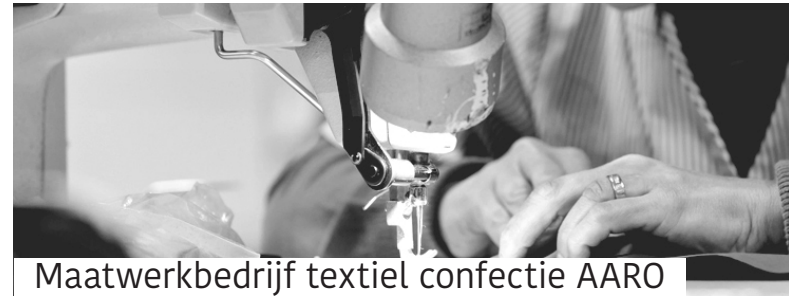
Maatwerkbedrijf textiel confectie AARO