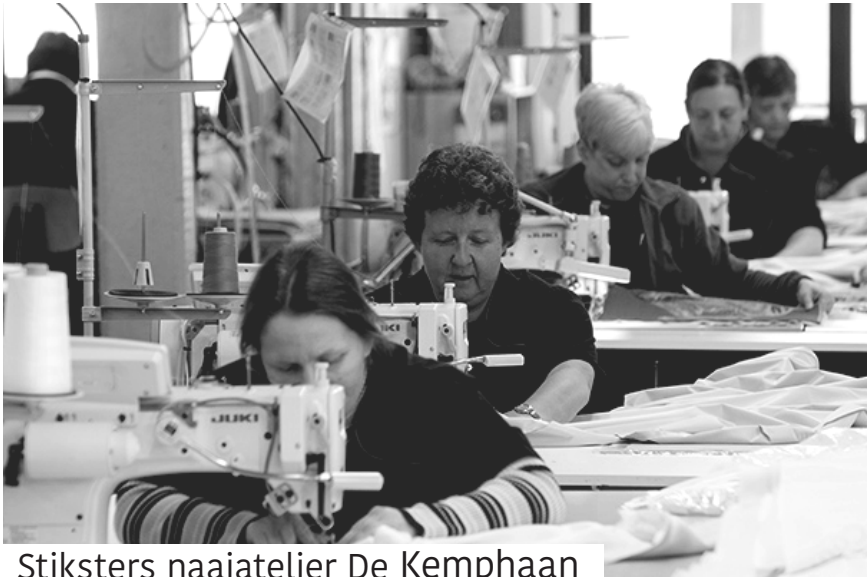
Stiksters naaiatelier De Kemphaan